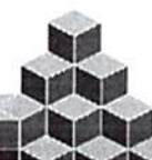
MILTON DE SOUZA AMORIM PREFEITO MUNICIPAL